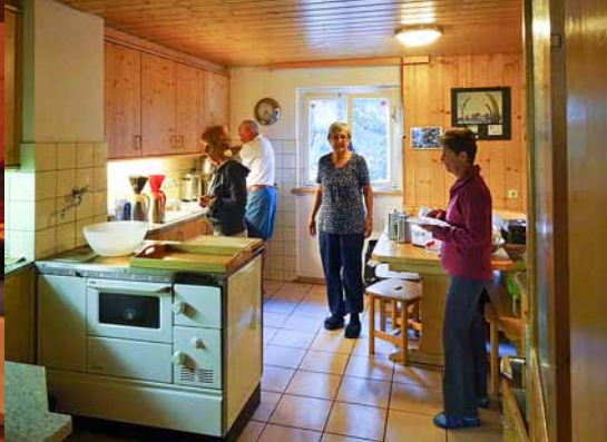
In der Küche 3