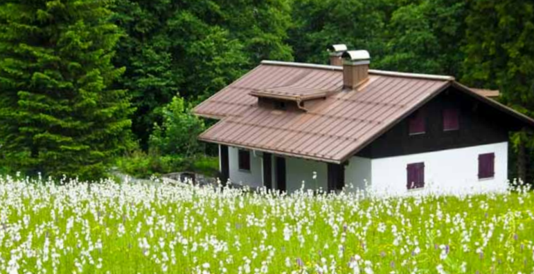
Gauenhütte im Sommer 2