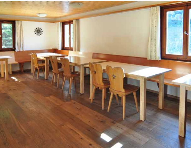
In der Stube 2

Die Hütte ist besonders gut geeignet für Familien-/Gruppenaufenthalte. Im Sommer ist die Hütte ein idealer Ausgangspunkt für Wanderungen und im Winter Stützpunkt für Skitouren. Alle Skigebiete im Montafon sind auf kürzestem Weg zu erreichen. Die Golmerbahnen sind ganzjährig ohne Auto zu erreichen. Im Bereich der Lindauer Hütte (1 Std. oberhalb der Gauenhütte) ist neu ein interessanter, größerer Klettergarten eingerichtet worden. Auf dem Weg dorthin sind bereits in unmittelbarer Nähe der Gauenhütte an verschiedenen Felsen Boulderprobleme zu lösen.