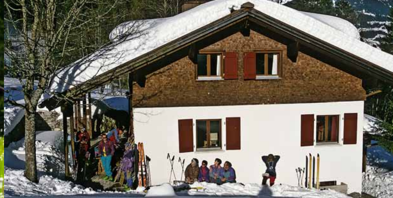
Gauenhütte im Winter 3