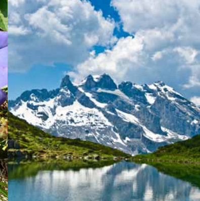
Tobensee mit Drusentürmen und Drusenfluh 4