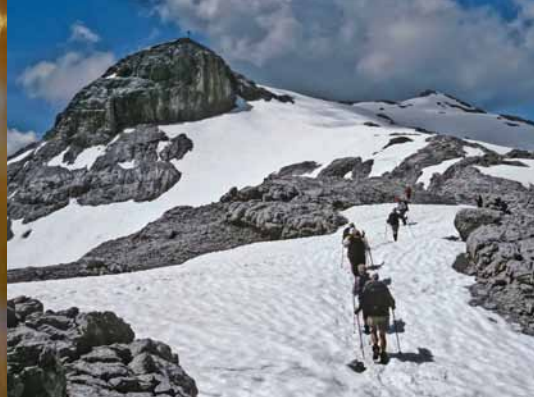
Vor dem Gipfel der Sulzfluh 3