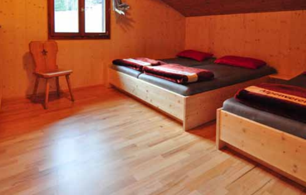
Zimmer in der Hütte 2